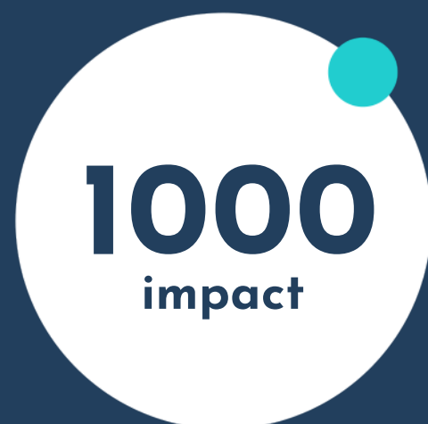
Campania de Paște