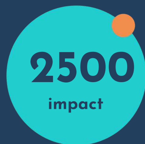
Campania Hai la școală