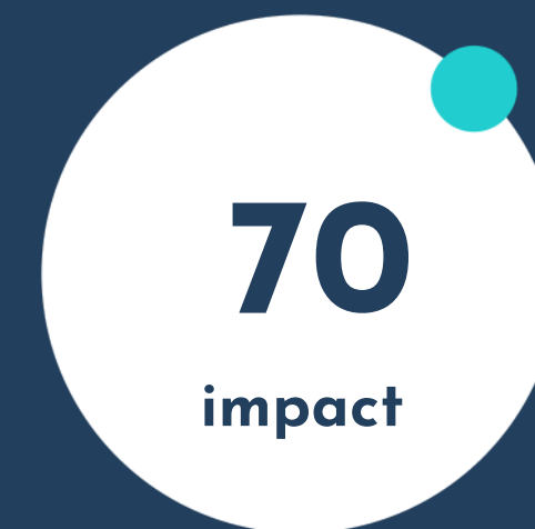
Proiect :Mobilitate fără frontiere

Cazurile susținute în baza proiectelor conform platformei www.fundatiapremiereenergy.md , în baza solicitărilor în direcțiile: